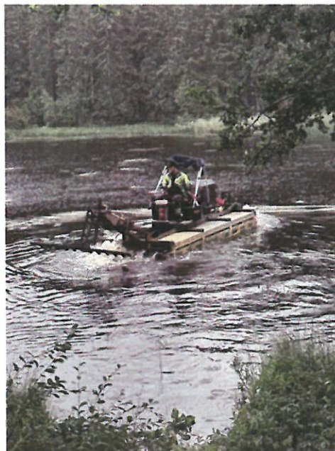
Slätter av vattenväxter i augusti 2023

Vattenområdenas ägare är Iskmo Samfälligheter och Norra Jungsunds skifteslag.